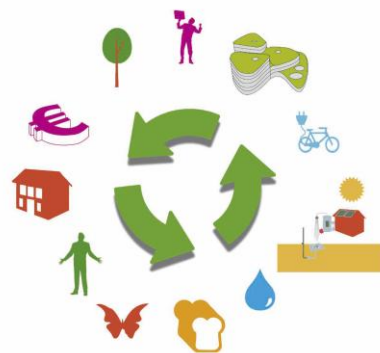
Fig. De 7 Reehorst principles

Daaronder vallen dan behalve een 'integrale duurzame ontwikkeling' ook een 'lokale voedselproductie', evenals de productie van duurzame energie samen met bedrijven en bewoners uit de omgeving op basis van een 'lokale energie-coöperatie'.