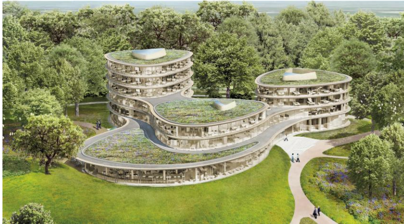
Fig: Het beoogde nieuwe kantoorgebouw van de Triodos Bank