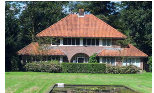
Patiëntenpaviljoen Altrecht, locatie Den Dolder

Wij kennen de regio als onze broekzak én de wetten en regels die flora en fauna moeten beschermen bij veranderingen. Wij zetten onze vakkennis in om plannen van overheden, projectontwikkelaars en grondbezitters duurzamer te maken. Het liefst in overleg in een vroegtijdig stadium. Lukt dat niet of onvoldoende, dan spannen we zo nodig een rechtszaak aan.