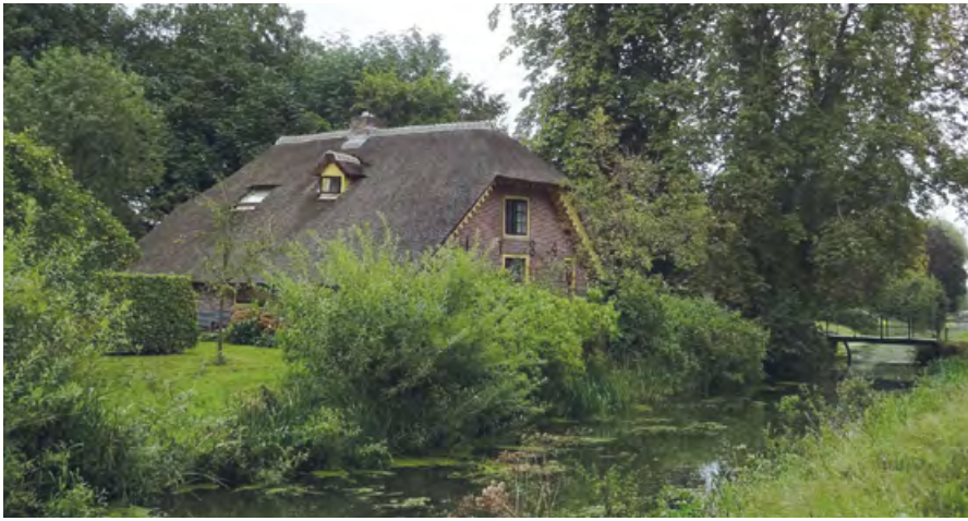
Boerderij aan de Langbroekerdijk, stammend uit 1784