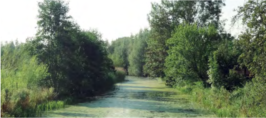
Biltse Grift ter hoogte van de Bisschopsweg

Leven in een gebied met een rijke cultuurhistorie, natuurschoon en veel groen: inwoners van Zeist en omliggende gemeenten vinden dit vanzelfsprekend.